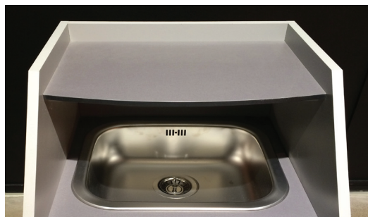
Глубокая раковина из нержавеющей стали.

Лед и остатки напитков занимают лишнее место в ваших пакетах? Вам нужно отделить жидкость от тары? Если да, то TOM 3R - является правильным решением для вас!