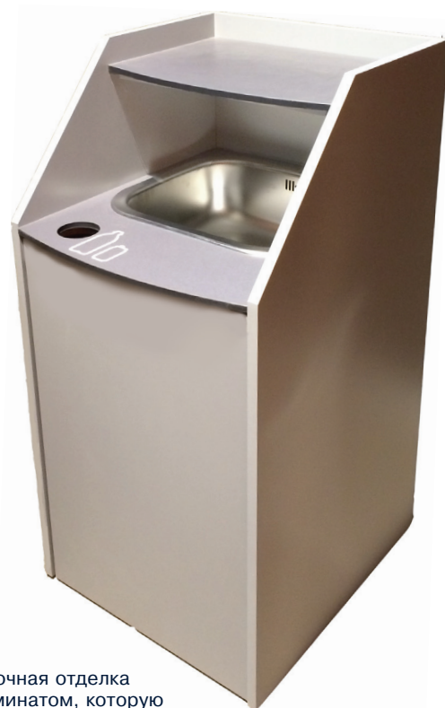
Прочная отделка ламинатом, которую легко вытереть и содержать в чистоте.

Верхняя полка предназначена для использования в качестве держателя подносов, а так же TOM 3R имеет отверстие и отдельный бункер для сбора бутылок и / или алюминиевых банок. Превратите отходы в доходы!